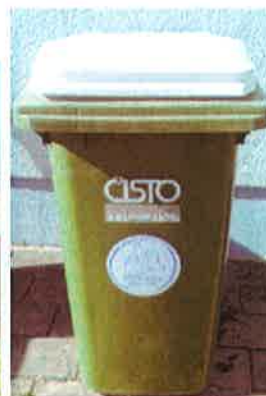
Fotografija 8 in 9: Posode za zbiranje stekla (steklene embalaže)