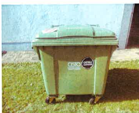
Fotografija 2 in 3: Posode za mešane komunalne odpadke