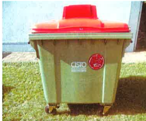
Fotografija 5 in 6: Posode za zbiranje papirja

Za zbiranje plastične embalaže ter ločenih frakcij iz plastike bomo uporabljali: