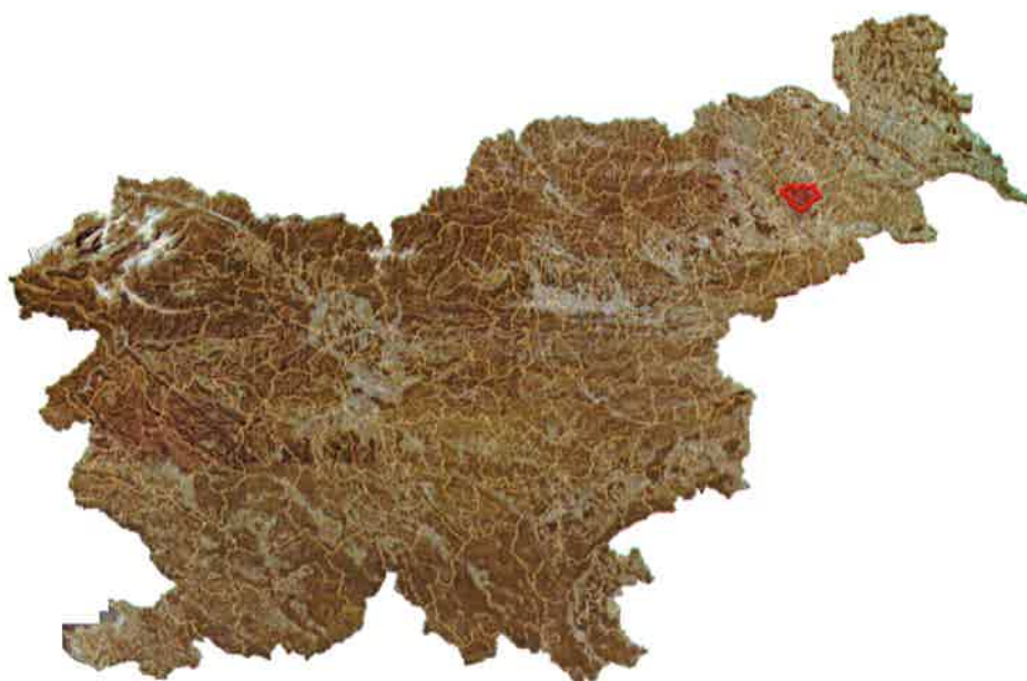
Slika 2: Lega občine Destričnik