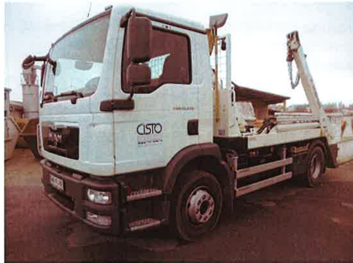
Fotografija 14: Vozilo za prevoz kontejnerjev

Za zbiranje in prevoz odpadkov iz zbirnih centrov, uporabljamo specialna komunalna vozila za odvoz kontejnerjev večjega volumna: