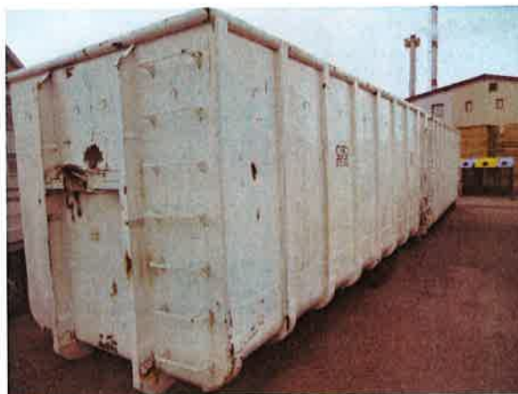
Fotografija 10 in 11: Kovinski kontejnerji