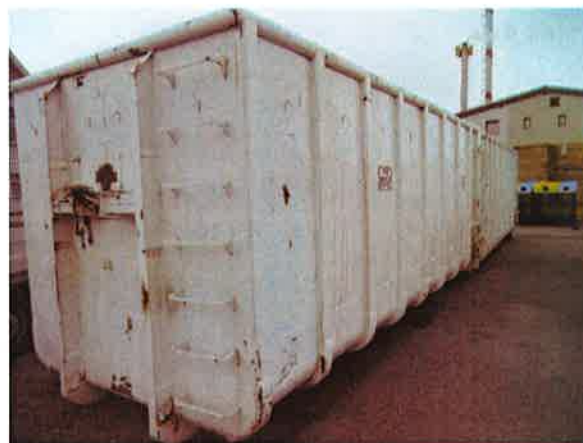
Fotografija 15 in 16: Kontejnerji različnih volumnov za zbiranje kosovnih in drugih odpadkov