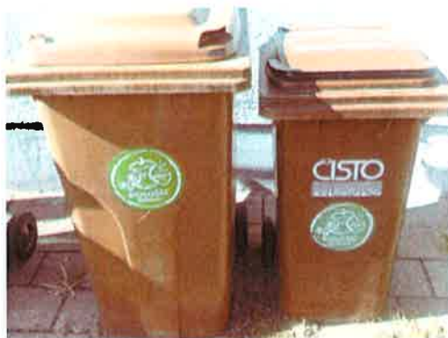
Fotografija 4: Posode za biološke odpadke