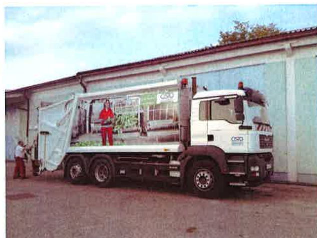
Fotografija 12 in 13: Smetarska vozila