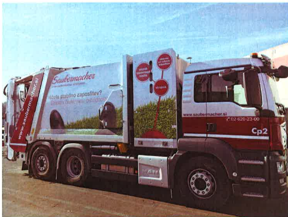
Fotografija 19: Vozilo za pranje zabojnikov za zbiranje bioloških odpadkov