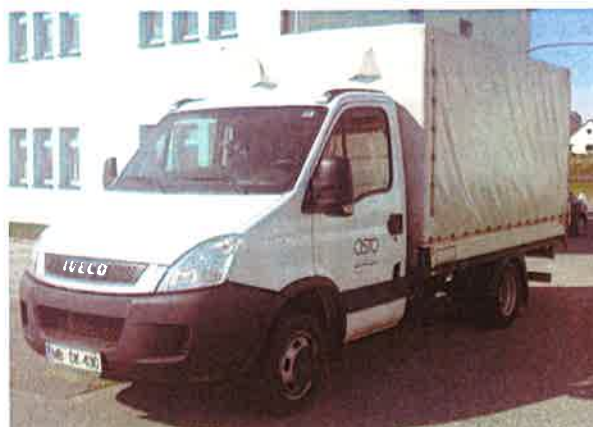
Fotografija 18: Vozila za prevoz in zbiranje nevarnih odpadkov

Za zbiranje in prevoz nevarnih frakcij uporabljamo specialna vozila, s pokritim kesonom in dovoljenjem za prevoz nevarnih snovi.