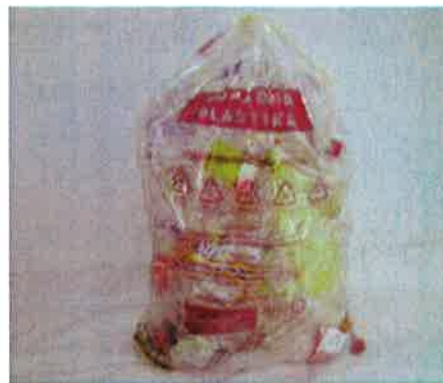
Fotografija 7: Vrečka za mešano embalažo

Za zbiranje steklene embalaže, uporabljamo plastične zabojnike, volumnov 240 l in 1100 l in sicer: