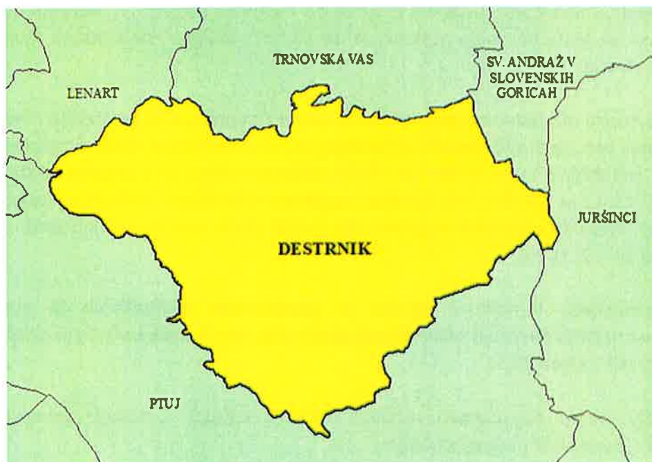
Slika 1: Zemljevid občine Destrnik