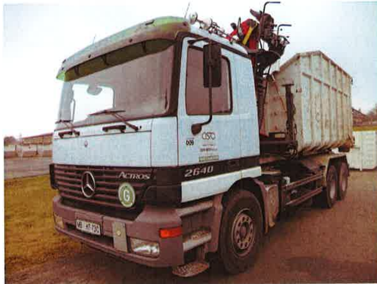
Fotografija 17: Vozilo za prevoz kotalnih prekucnikov

Za prevzemanje in prevoz kosovnih odpadkov uporabljamo kontejnerska vozila ter vozila za prevoz kotalnih prekucnikov.